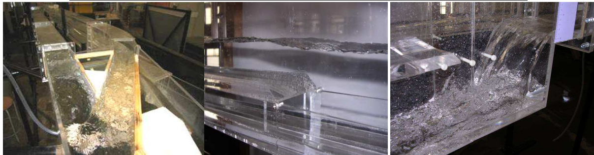
MODELLO REALIZZATO PRESSO IL LABORATORIO DI IDRAULICA DEL POLITECNICO DI MILANO

Studio Paoletti Ingegneri Associati - Progetto del modello, specifiche di prova, sperimentazioni, interpretazione dei risultati, progetto degli interventi definitivi