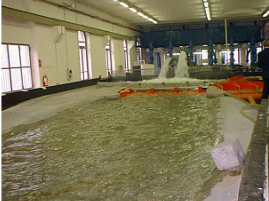
Politecnico di Milano. Vista d'insieme del modello idraulico con la traversa sullo sfondo

MODELLO FISICO DELLA TRAVERSA E DELL'OPERA DI PRESA DI PONT VENTOUX, REALIZZATO PRESSO IL POLITECNICO DI MILANO ETATEC Srl - Milano