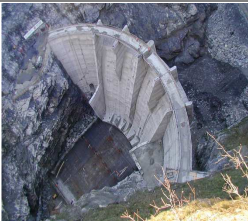
Diga di Susa

MODELLO FISICO DELLA DIGA DI SUSÀ REALIZZATO PRESSO IL POLITECNICO DI TORINO ETATEC Srl - Milano