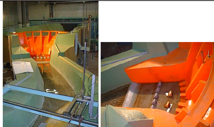
Politecnico di Torino. Modello della diga e della vasca di dissipazione

ETATEC Srl - Progetto del modello, specifiche di prova, sperimentazioni, interpretazione dei risultati, progetto degli interventi definitivi Anno 1996 - 2002